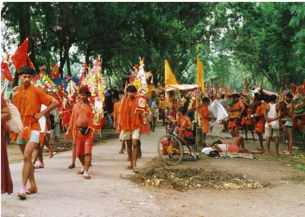
Pelgrims op weg met Gangeswater (in de buurt van Rishikesh - juli 2001)

Overal in India leeft het grote verlangen minstens eenmaal in het leven op bedevaart te gaan naar de heilige plaatsen aan de Ganges. Mensen sparen soms een leven lang om bijvoorbeeld naar Haridwar te gaan en van daaruit Gangeswater mee naar huis en naar het dorp te nemen. Meestal zijn het uitverkoren jonge mannen die op pad gestuurd worden. Sommigen leggen daarvoor duizenden kilometers af, zo nodig te voet. Het is een ongelooflijke belevenis om bij gelegenheid al deze mensen, beladen met kruiken Gangeswater, aan stokken opgehangen die over de schouder gedragen worden, langs de wegen te zien stappen. Uitgelaten, vreugdevolle gezichten. Sommigen blootsvoets. Thuis wacht de gemeenschap vol ongeduld op hun terugkeer. Denk hier maar aan onze bedevaarten naar Lourdes en het Lourdeswater dat de pelgrims meebrengen. Echter, vermenigvuldigd de waarde die daaraan gehecht wordt maar met honderd of duizend.